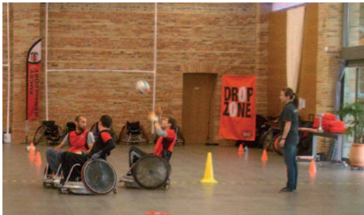
Une intervention en entreprise du Stade Toulousain de Rugby handisport

Dès le printemps 2012, l'équipe médico-sociale du Centre de prévention Montpastel vous accueillera, vous ou votre conjoint, dans ses locaux situés en plein centre de Montpellier, à proximité immédiate du tramway et de la place de la Comédie, pour effectuer un bilan de prévention. Les centres de prévention permettent aux retraités ainsi qu'aux actifs de plus de 50 ans relevant des institutions de retraite Agirc-Arrco ou d'institutions de prévoyance partenaires de bénéficier d'un bilan médico-social personnalisé, de bilans complémentaires éventuels (mémoire, posture...) et de participer à des conférences de sensibilisation sur le sommeil, la nutrition, etc. ■