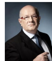
PRÉSIDENT RENÉ ROCHE (CFE - CGC)