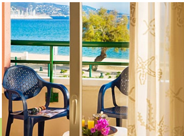
L'Oustal del Mar

au 04 94 01 81 88 ou par courriel : loustal-del-mar@wanadoo.fr