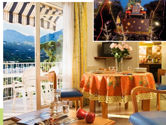
L'Oliveraie côté colline

au 04 93 28 62 00 ou par courriel : resa@oliveraiementon.fr www.oliveraiementon.fr