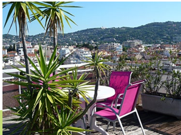
La terrasse du club maintenon